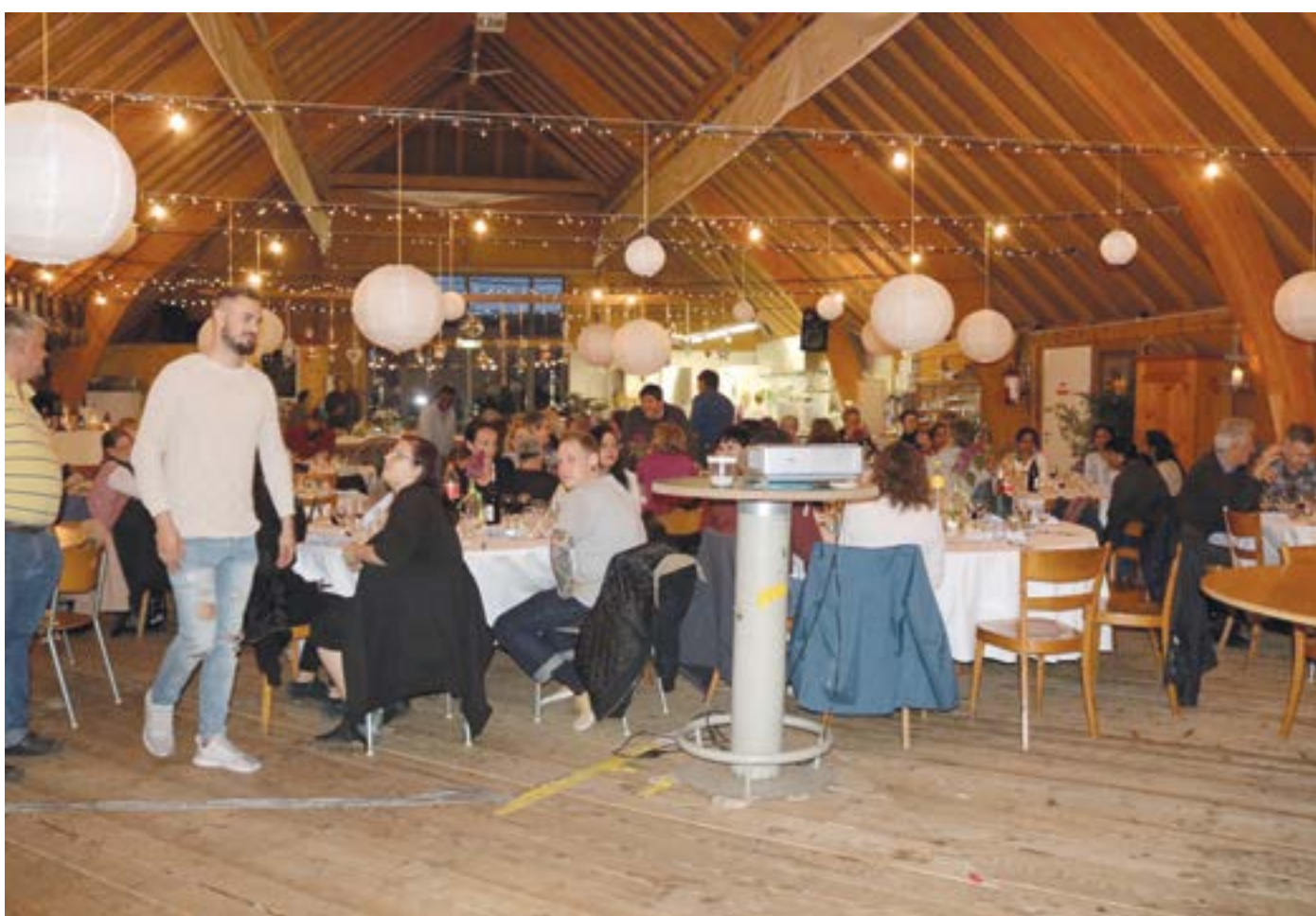
Mitarbeiterfeier der Bürgergemeinde Solothurn.